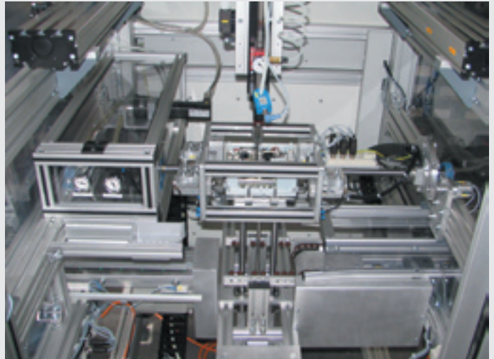
Wendestation mit Schraubspindel

Die werkstückspezifisch protokollierten Daten können jederzeit eingesehen und zur eventuellen Fehleranalyse hinzugezogen werden.