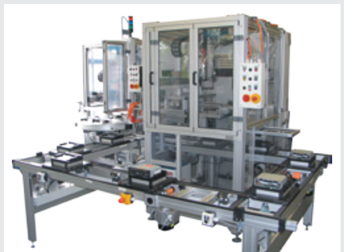
Schraubautomat mit Bandumlauf