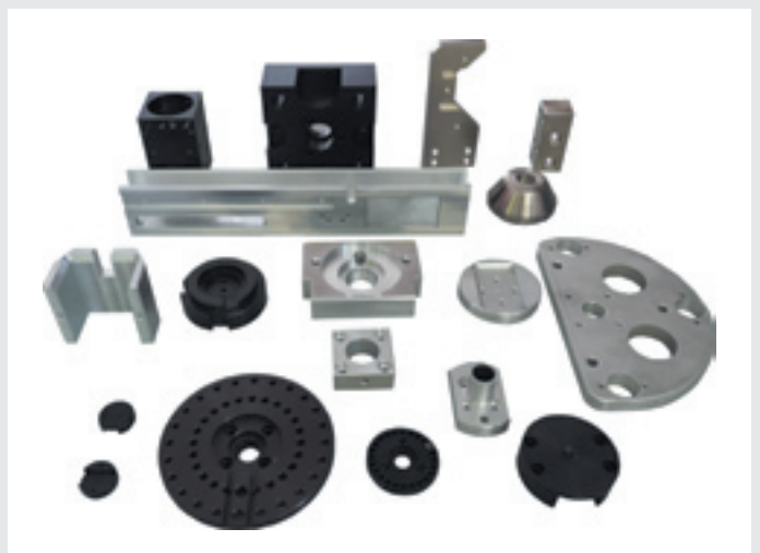
Dreh- und Frästeile